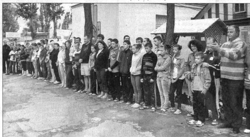
На лінійці на честь підйому прапора у День Конституції.